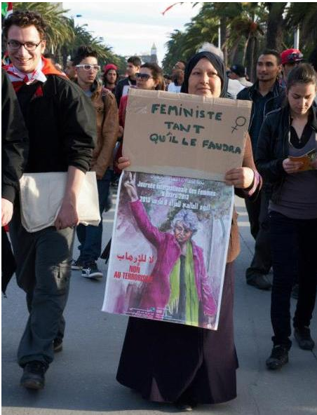
Manifestation au Forum social mondial, Tunis, 2013, Photo: Judith Trudeau

La composition étudiante n'est évidemment pas homogène d'un collège à l'autre. Ainsi, enseigner au Vieux Montréal et enseigner à Lionel-Groulx, cela ne veut pas dire la même chose. Les étudiantEs devant nous ne sont pas les mêmes, n'ont pas le même parcours ni les mêmes réalités.